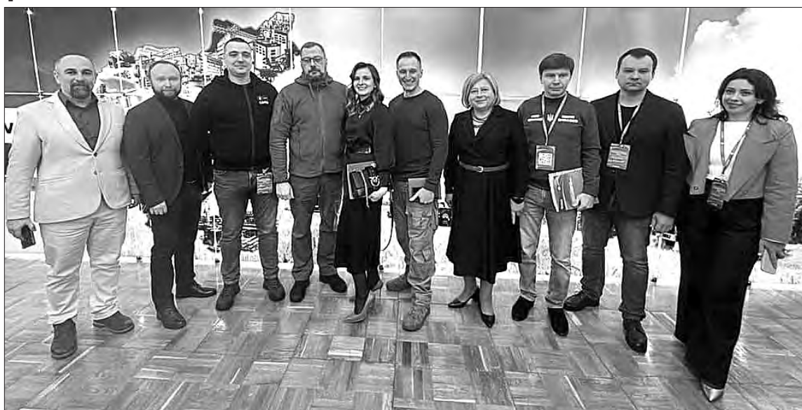
Команда з Івано-Франківщини.

Форум організували ГО «Розвиток бізнес сектору України», представники Чернігівської торгово-промислової палати та ОВА. Серед головних тем заходу — розроблення державної та регіональних стратегій відновлення визволених регіонів, виклики та проблеми бізнесу, інструменти економічної підтримки малого та середнього бізнесу, розвитку інфраструктури.