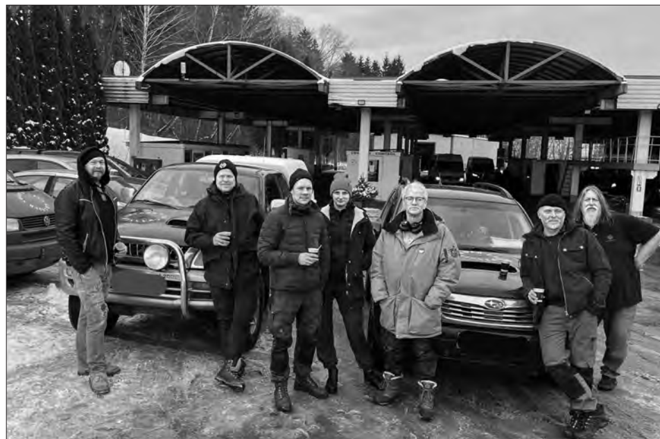
Шведсько-норвезький волонтерський десант.