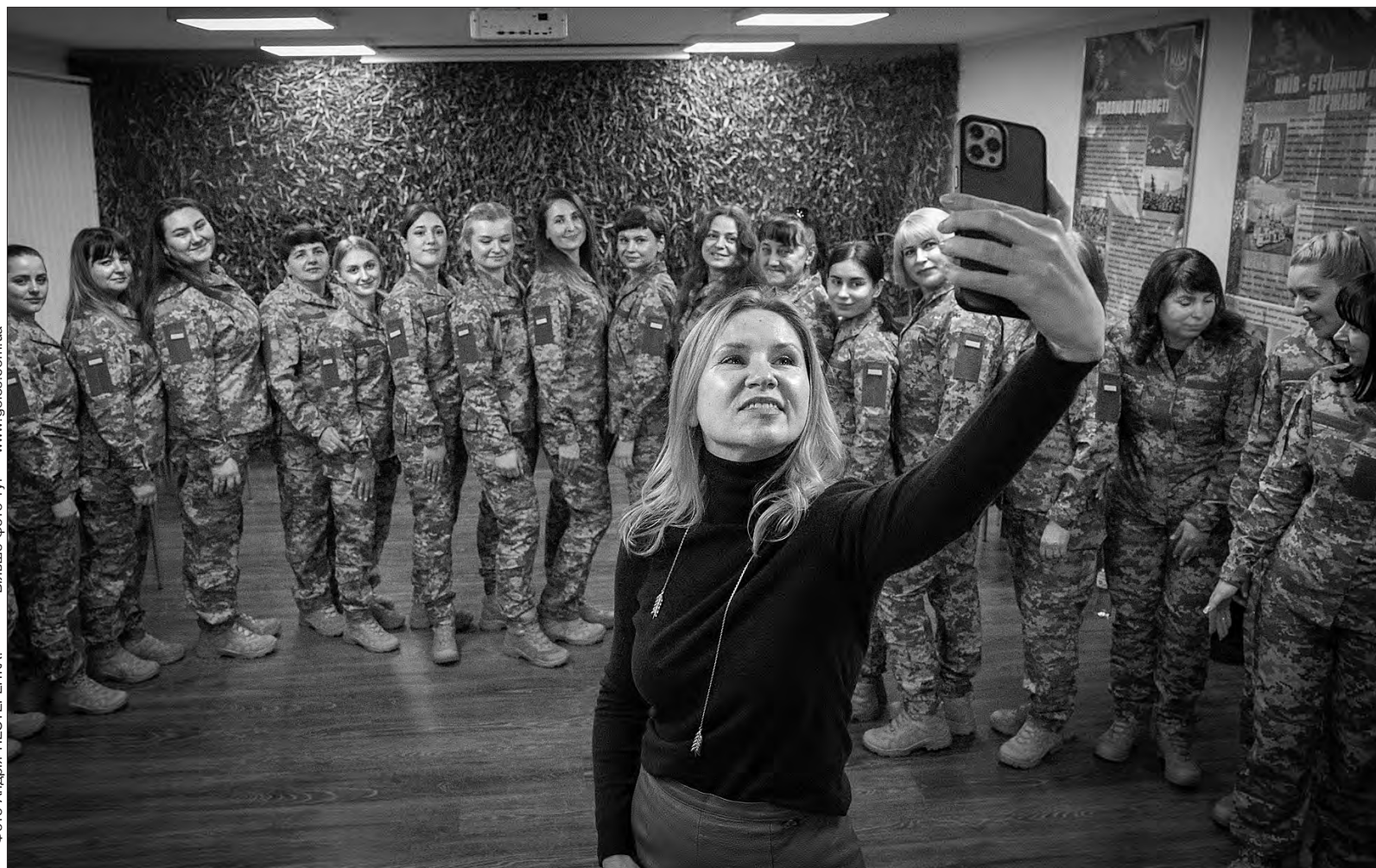
Більше фото тут — www.golos.com.ua

Заступниця Голови Верховної Ради України Олена Кондратюк разом із колегами — народними депутатами, які представляють у парламенті міжфракційне об'єднання «Рівні можливості», взяла участь у презентації нових одностроїв для жінок-військовослужбовиць, яку організували в Міністерстві оборони.